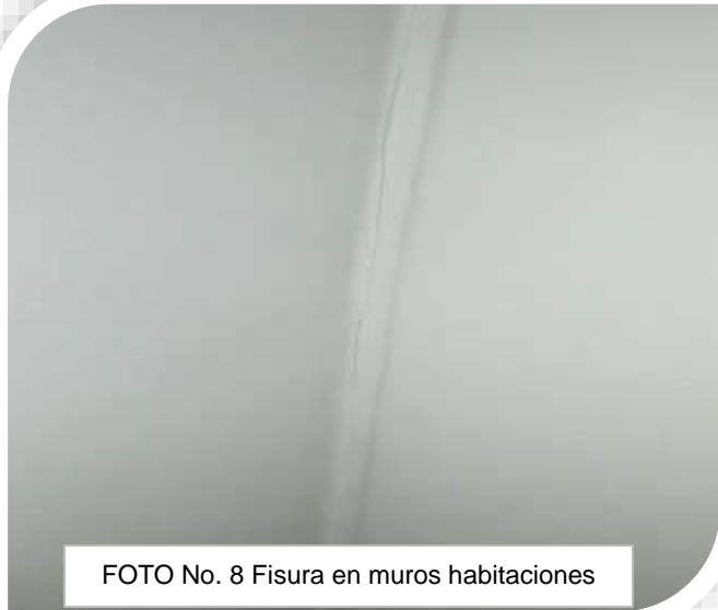
FOTO No. 8 Fisura en muros habitaciones