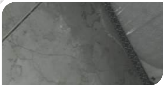
FOTO No. 7 Fisura Baldosa Ducha