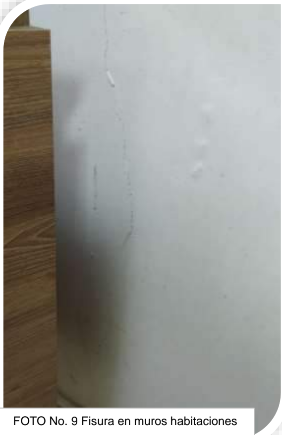
FOTO No. 9 Fisura en muros habitaciones