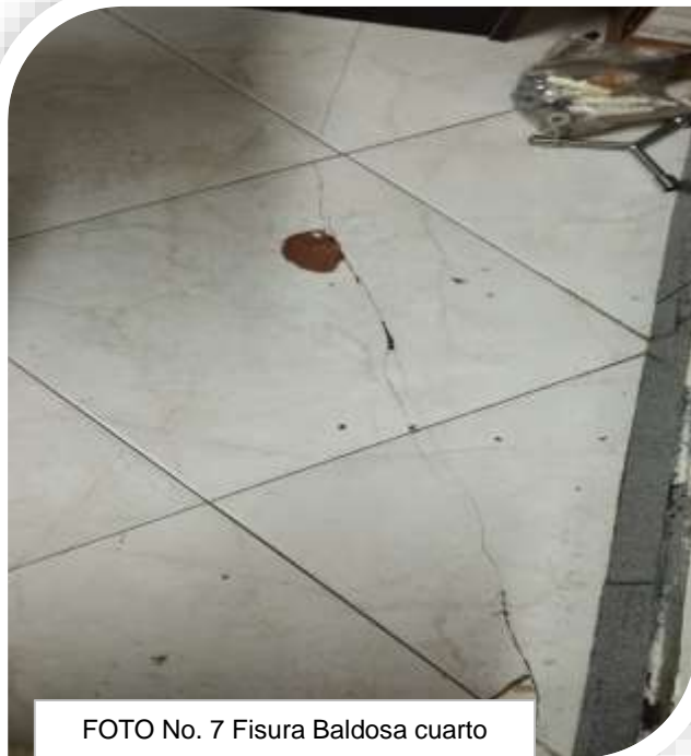
FOTO No. 7 Fisura Baldosa cuarto