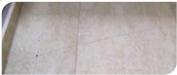
FOTO No. 5 Fisuras pared baño